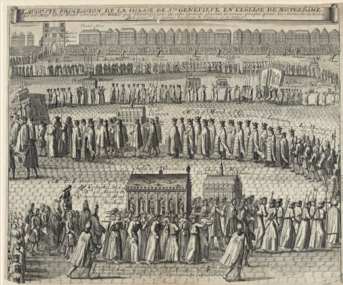
Attribué à Jacques-Valentin Radiguès, L'Auguste Procession de la châsse de sainte Geneviève en l'église de Notre-Dame , 1694. Paris, musée Carnavalet – Histoire de Paris

Les processions de sainte Geneviève, protectrice de Paris, constituent des rendez-vous marquants de la vie culturelle et religieuse de la capitale depuis le Moyen-Âge. Pour la période allant de 1600 à 1725, on compte 11 célébrations de la sainte sur les 91 qui eurent lieu à l'époque moderne (1500-1725).