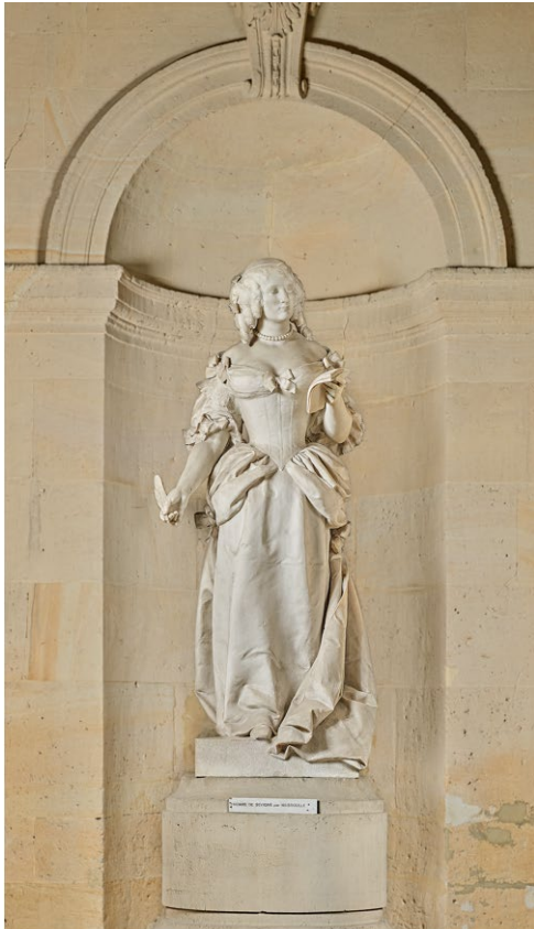
André Massoulle, Madame de Sévigné, 1894. Saint-Denis, maison d'éducation de la Légion d'honneur