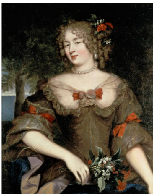
Attribué à Pierre Mignard, Françoise-Marguerite de Sévigné, comtesse de Grignan (1646-1705) , vers 1669. Paris, musée Carnavalet – Histoire de Paris

Simon Arnauld de Pomponne, conseiller d'Etat et cousin par alliance de l'accusé, est exilé à Verdun. Afin d'informer cet ami du développement de l'affaire jugée à huis clos, la marquise tient un journal grâce au récit des audiences que lui fait un membre de sa famille. Ces échanges politiques courageux auraient pu entraîner sa perte s'ils avaient été interceptés. Les lettres qui nous sont parvenues témoignent d'entretiens difficiles entre une cour hostile et un accusé qui se défend point par point. La marquise donne parfois vie au récit en restituant le ton et les exclamations des protagonistes. Le 19 décembre 1661, Sévigné dévoile l'information éminemment secrète du nom des juges qui ont voté la mort et de ceux favorables au bannissement. Elle confie même que Fouquet est parvenu à communiquer avec une de ses amies afin de l'avertir, avant les officiers, de l'arrêt rendu par la cour. Le verdict tombe : il est condamné à l'exil permanent. Mais Louis XIV aggrave la peine en emprisonnement à vie. La marquise est persuadée de la machination d'un tiers. Elle ne nomme pas Colbert, mais c'est lui qu'on décèle dans les accusations qu'elle porte. Fouquet meurt en détention dans la forteresse de Pignerol.