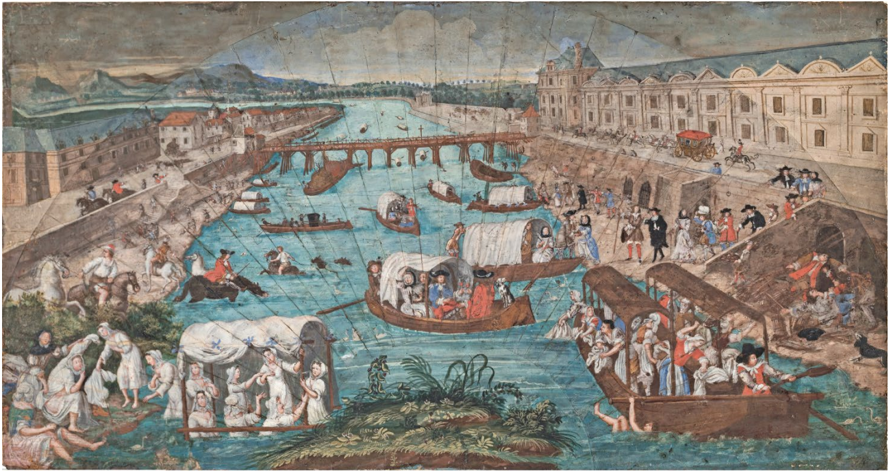
Les Bains en Seine devant le pont Rouge, avant 1684. Laas, collection du château de Laas

Certaines processions offrent néanmoins l'occasion aux dames de qualité de fouler le pavé. Mais la marquise cantonne le plus souvent ses déplacements à son quartier, allant jusqu'à Notre-Dame assister à une messe et visiter les malades de l'Hôtel-Dieu.