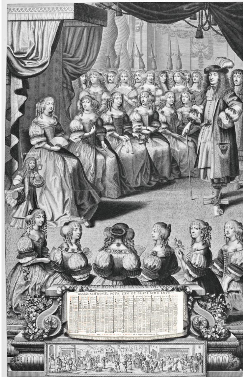
Pierre II Mariette et Pierre Landry (éditeurs), Le Cercle royal de la cour de France, almanach , 1667. Paris, musée du Louvre, département des Arts graphiques, collection Edmond de Rothschild

Être assise en présence de la reine (ici à gauche) est un privilège remarquable octroyé à certaines dames de la haute noblesse. Cette prérogative « du tabouret », âprement disputée, expose en réalité les femmes, sous des prétentions et des rivalités futiles, à défendre la place de leur clan face à la reconnaissance royale. Au bas de l'Almanach, bien éloigné des préoccupations de la Cour, le cartouche présente l'une des directives de la « nouvelle police établie dans Paris » : l'obligation de déverser ses ordures pour la collecte.