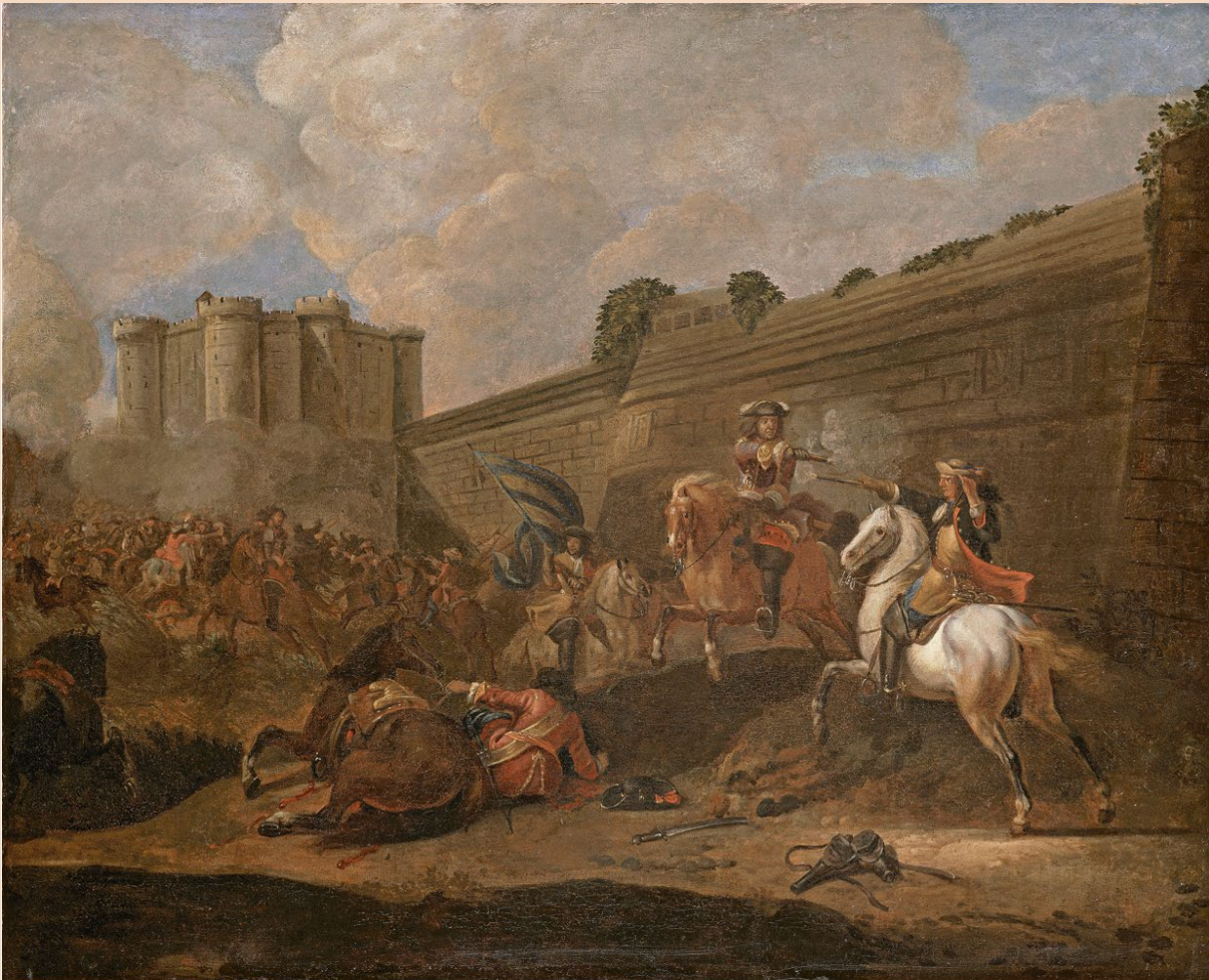
Attribué à Adam-François Van der Meulen, Épisode de la Fronde : combat sous les murs de la Bastille , après 1652. Paris, musée du Louvre, département des Peintures, en dépôt au musée national des châteaux de Versailles et de Trianon

Pour une analyse approfondie de cette peinture :