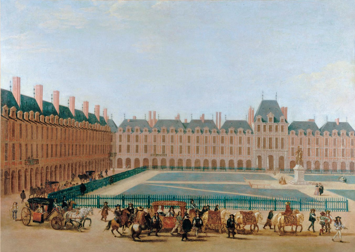
Ecole française, La Place Royale , vers 1665. Paris, musée Carnavalet – Histoire de Paris

La place Royale est ici vue du côté de l'hôtel de Coulanges, où Marie de Rabutin-Chantal habite jusqu'à l'âge de 10 ans. Au premier plan le cortège royal. Au second plan, la statue équestre de Louis XIII. Au fond, le côté nord de la place avec le pavillon de la Reine.