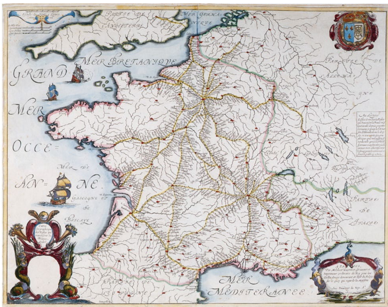
Guillaume et Adrien Sanson (géographes-éditeurs), Carte géographique des postes qui traversent la France, 1690. Paris, collection musée de La Poste

En 1672, à la demande du roi, la poste aux lettres devient Ferme générale, et ses administrateurs sont désormais responsables de la gestion des revenus générés par les taxes de port, mais aussi du fonctionnement du réseau de bureaux. Un envoi par le biais de la poste royale reste, à cette époque, bien plus rapide que le transport par messenger privé sur les routes secondaires, puisque seuls les agents de l'administration postale sont autorisés à circuler au galop sur les routes principales du royaume.