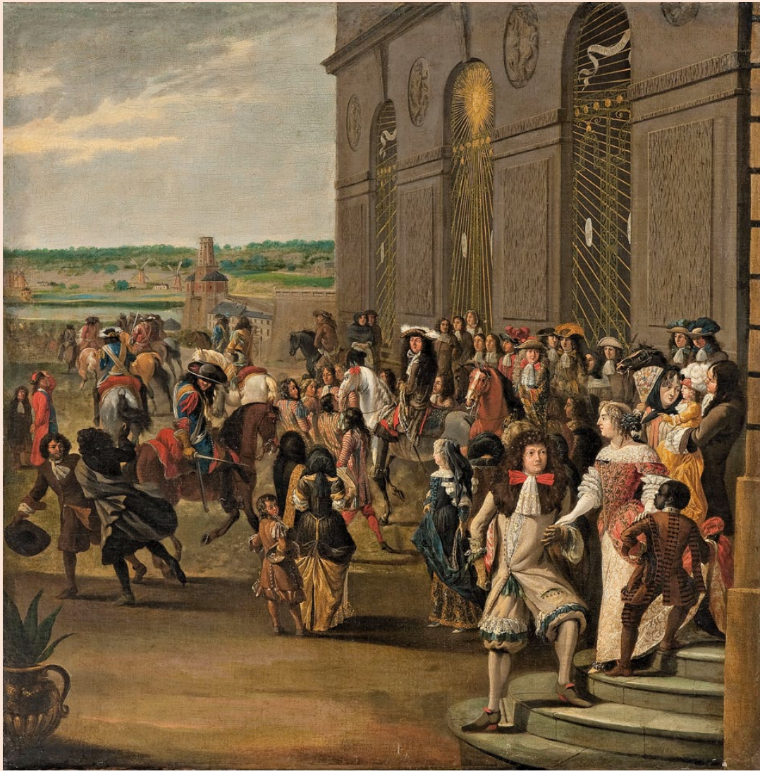
Ecole française, Louis XIV devant la grotte de Téthys , après 1670. Versailles, musée national des châteaux de Versailles et de Trianon

Pour une analyse approfondie de cette peinture :