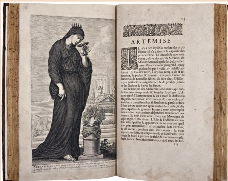
Pierre Le Moyne, « Artemise », La Galerie des femmes fortes , t. I, 1663. Paris, bibliothèque Marguerite Durand

Dédié à Anne d'Autriche, l'ouvrage de Pierre Le Moyne La Galerie des femmes fortes (1647) illustre un thème largement présent dans les arts de la première partie du 17 e siècle. À travers les exploits édifians de Zénobie, Lucrece ou Marie Stuart, les vertus héroïques de figures féminines empruntées à l'histoire ancienne et moderne sont célébrées. Ces exemples fameux rencontrent alors un écho dans l'actualité du temps. Les destins remarquables de la reine Christine de Suède, des frondeuses ou de la mère du roi revêtent une forme d'exemplarité pour celles qui, comme Madame de Sévigné, jouissent de l'autonomie exceptionnelle que leur confère le veuvage.